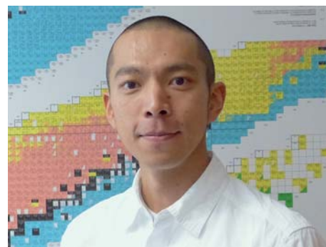
Dr. Atsushi Ikeda

Zwar ist diese chemische Entschlüsselung auch an anderen Einrichtungen möglich – dort aber meistens nicht mit radioaktiven Substanzen. „Solche Experimente lassen sich in Europa fast nur an ROBL durchführen“, erzählt der Abteilungsleiter. Die Proben, die er in Dresden vorbereitet, schickt er deswegen zur Untersuchung nach Grenoble, bevor sie anschließend wieder am HZDR ausgewertet werden. „Besonders bei Substanzen im flüssigen Zustand ist dies nicht ganz einfach“,