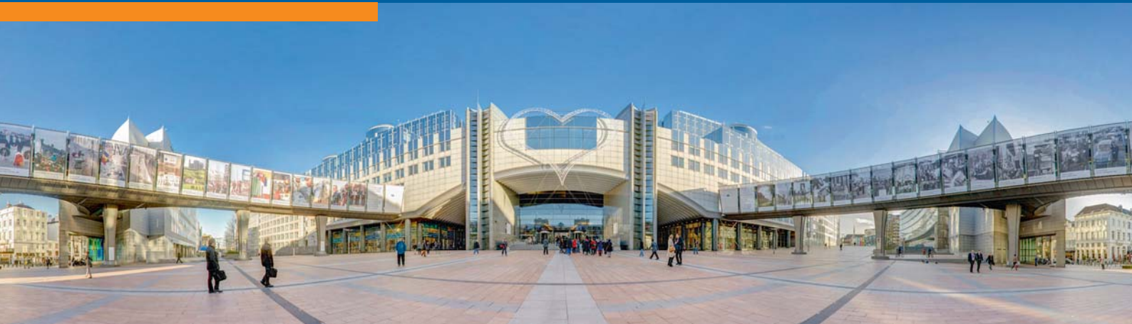
European Union 2013 - EP Altiero SPINELLI building: Architecte: AEL